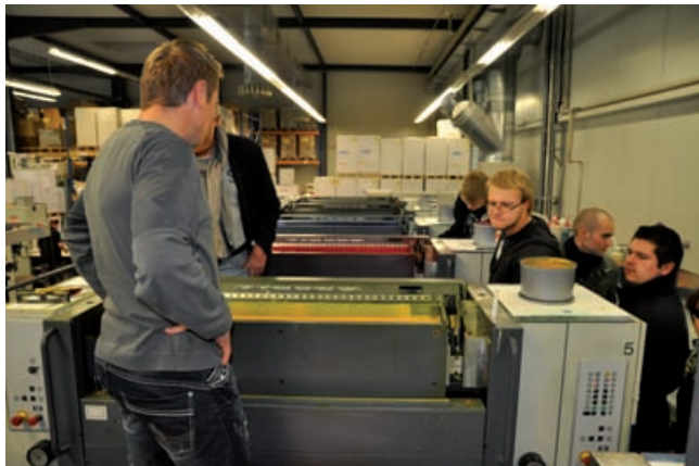
Blick in die (begehbare!) Druckmaschine

Anlass war die Andruckbeurteilung und Druckfreigabe der neuen, achtseitigen EST-Infobroschüre.