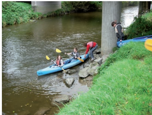
Das Einwässern gelang meist trockenem Fußes

Die Klassenlehrer der EFS110 und 210 entschieden sich dazu, als Kennenlernausflug eine Kanutour durchzuführen.